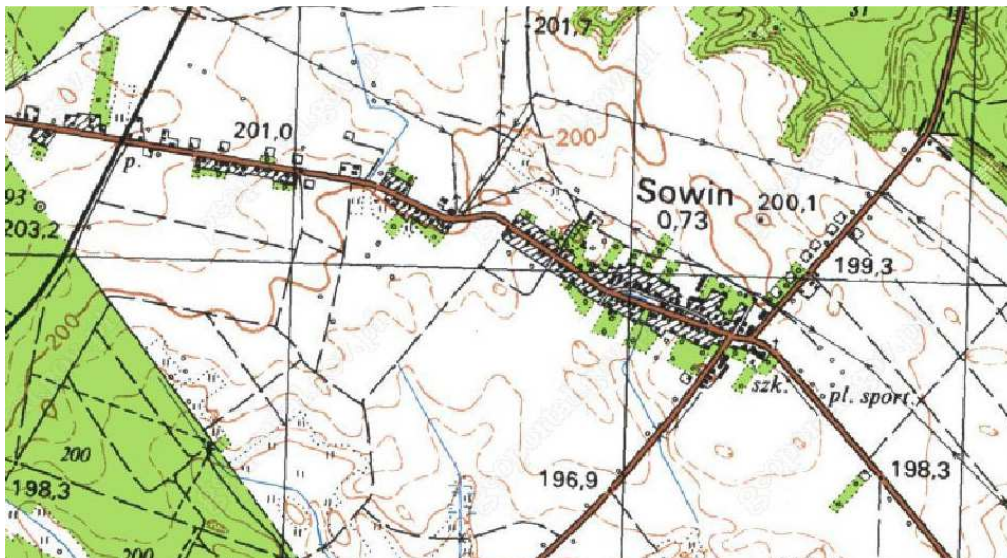
Sowin – mapa topograficzna.