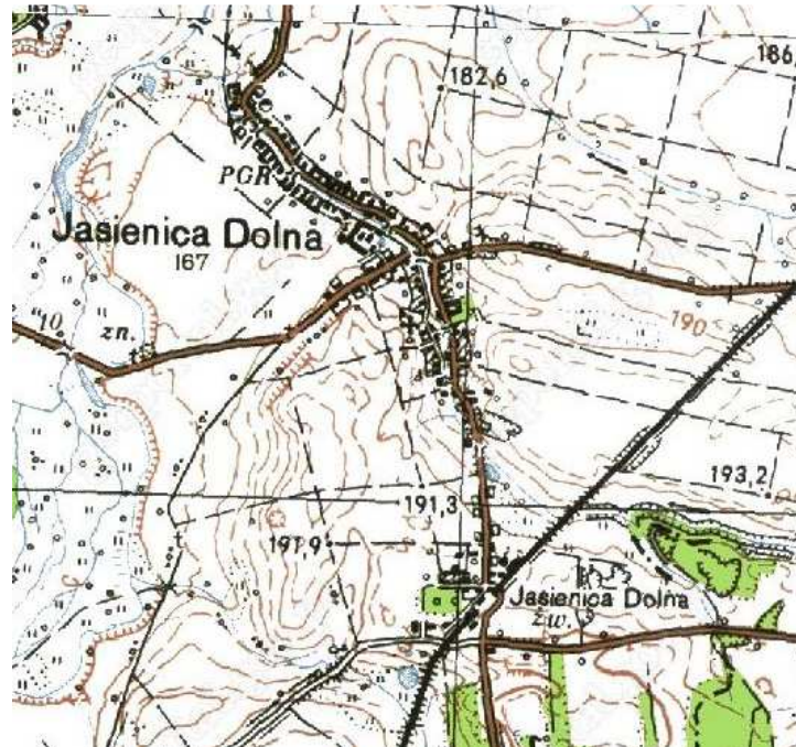
Jasienica Dolna – mapa topograficzna.