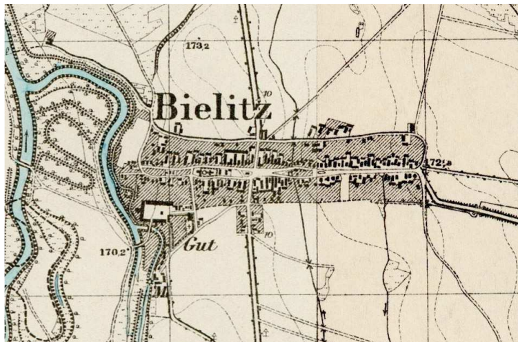
Mapa z roku 1936 r.